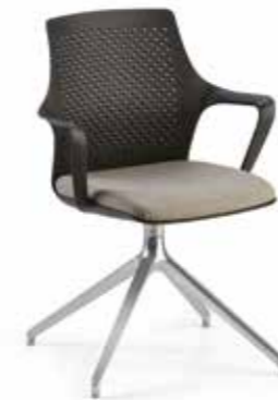
RK12 Sedia girevole base in alluminio a piramide Swivel chair with pyramid aluminum base