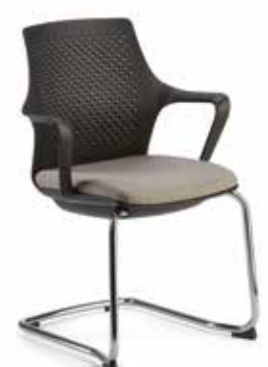
RK13 Sedia fissa telaio a slitta Fixed chair with sled frame