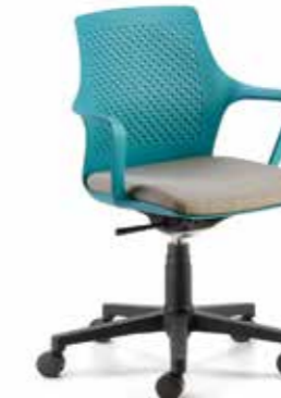
RK21 Sedia girevole base in nylon nera e oscillante Swivel chair base in black and oscillating nylon