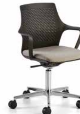
RK11 Sedia girevole base in alluminio e oscillante Swivel chair aluminum base and oscillating