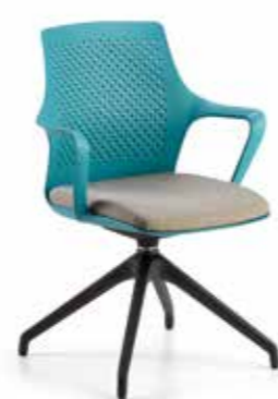
RK22 Sedia girevole base in nylon nera a piramide Swivel chair base in black pyramid nylon