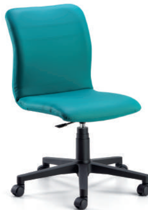
GAMMA EXECUTIVE CHAIR