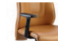
Braccioli in nylon regolabile. Armrests in adjustable nylon.